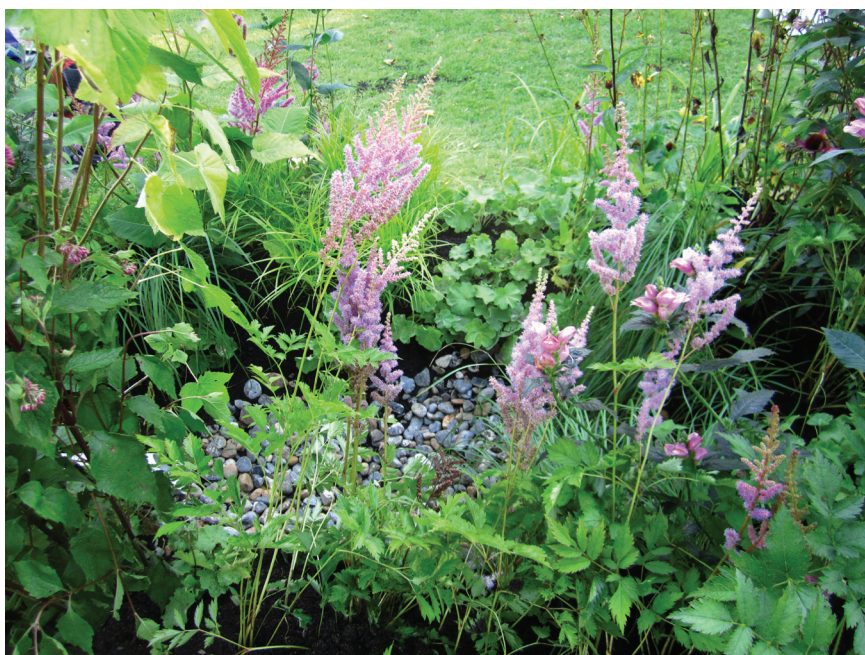
Det er vigtigt at plante tæt for at opnå et frodigt udtryk i regnbedet.

Du sikrer bedets frodighed bedst ved ikke at plante i for store grupper, men blande planterne mellem hinanden, som man også ser det i naturen.